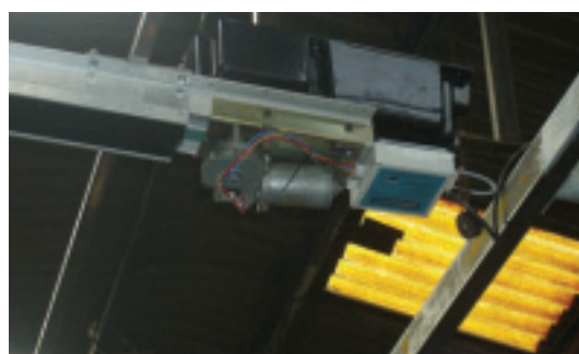
Im Mittelpunkt des Centadrive-Torsystems steht diese kleine Elektronik-Box