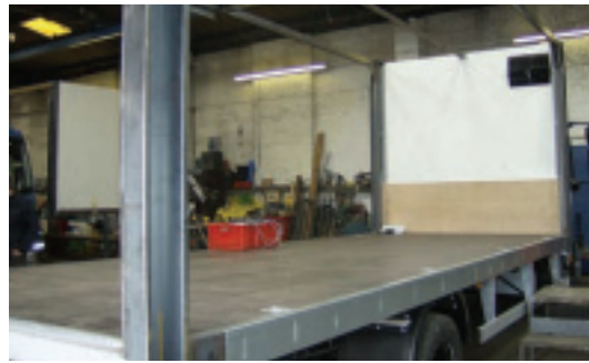
Erfolgreiche Torinstallation, Schritt für Schritt

Eine überaus einfache Idee mit einem interessanten Hintergrund. Jährliche Brainstorming-Sessions bei Albert Jagger haben jeweils zum Ziel, mit drei – noch nicht