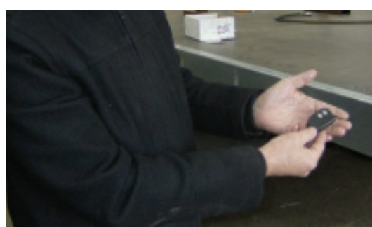
Der Schlüssel zum Erfolg des Tores ist ein simpler, per Schlüsselanhänger bedienter Mechanismus