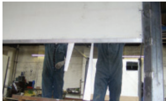
Das neue Tor kann in jeder beliebigen Position anhalten und zeichnet sich durch eine Fülle von Sicherheitsmerkmalen zur Gewährleistung des problemlosen Betriebs aus