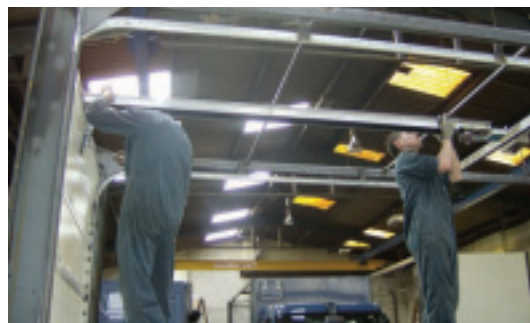
Das neue Tor ist sehr einbruchssicher und lässt sich einfach nachträglich in vorhandene Fahrzeuge einbauen